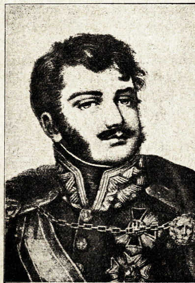
Książę Józef Poniatowski

ciw wojsku rosyjskiemu, które zawezwane przez Targowiczian, wkroczyło do Polski, ażeby znieść Konstytucję 3-go maja. Z powodu przystąpienia króla do Konfederacji Targowickiej, książę Józef podał się do dymisji i pozostał w kraju, nie biorąc jednak udziału