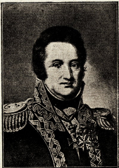
Jan Henryk Dąbrowski

ojczyzny. Układ co do utworzenia legionów zawarto 9 stycznia 1797 r. w Medjolanie.