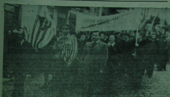
Fragment pochodu pierwszomajowego w Białymstoku. NA ZDJĘCIU: widzący maszerujących byłych więźniów obozów hitlerowskich.