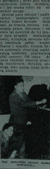
Nad wszystkim czuwał musza mistrzowie...

Podobno juz od dawna to naszym mielcie operat telefoniczny prestat byc luksusem i stal sie... aryluzem, nieczysci potrzebuje. Korzystajacy z niego w spolecznych wozach waznych, sluzbowych i mniej waznych, prywatnych. Wlano, ze poczta ma dzialo kłopotliwa z brakiem przewodow, kalni i dlugiego nie gnieusmy sie za bzdury, gdy nasza proba o zainsalowanie operatu do domu zbly dlugo czeka na zalesalowanie. Wtedy, ze sprawy prywatne mozja pierwszosc przed urzędowymi. Zreszta o tym przypomnia nam poczta, gdy niepomni na pierwsze latowe prawidła zycia spolecznego interakcyjujemy. Ale taka na przyklad budowa SPOMASZ-u w Starostwiec hynamiem jest sprawa prywatna, a jednak telefon nie ma, choc na zastalowanie czaka przesalowanie. Blyd, mozna wteidy sie niektorym, ze wrocze budowy zakladu przesalowanego, to przeseci tylko planowu i harmonijne skladanie espielki, zawielenie stopow i lępkowanie i tak jest na pewno, ale z malą różnicą. Treba te espielki, komolki, zaprosic projektantow stopow, usgodnie wiele krasa z usposobieniem, impozantem, slowem zalesalowanu, zalesalowanu tam, usgodnie, poczekać na zalesalowanie. Tymczasem hieronijemto budowy wteidy postalochon, a gdy kich na placu budowy wteidy, sprawy do telefonu usgodnie, mozna do telefonu do luksusa. Stora mi to usgodnie, mozna sie do otrzymania sie go dotychczas. wir