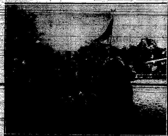
Defilada pułku kawalerii arabskiej świeżo przybyłego z Maroka- na do Paryża jako część załogi miasta.

— Wie Pan, nie może się tak całkowicie z Panem zgodzić, że małżonka Pańska nie ma zupełnie powodów do zazdrości. A owa brunetka z dzieckiem, to się nie liczy?! Jestem zdania, że dla szczęścia waszych bobasów powinien Pan natychmiast zejść się z żoną, nie dostarczać jej „urojonej” zazdro- ści tematów w rodzaju owej cma- nej czarnobrewy, zając się pracą i raz już do licha zacząć poważnie patrzeć na życie. Przecież nie jest Pan chyba stu- dakiem, który kocha się w Zosi szaleje za Marysią, a z Jadzią cho- dzi na ciastka.