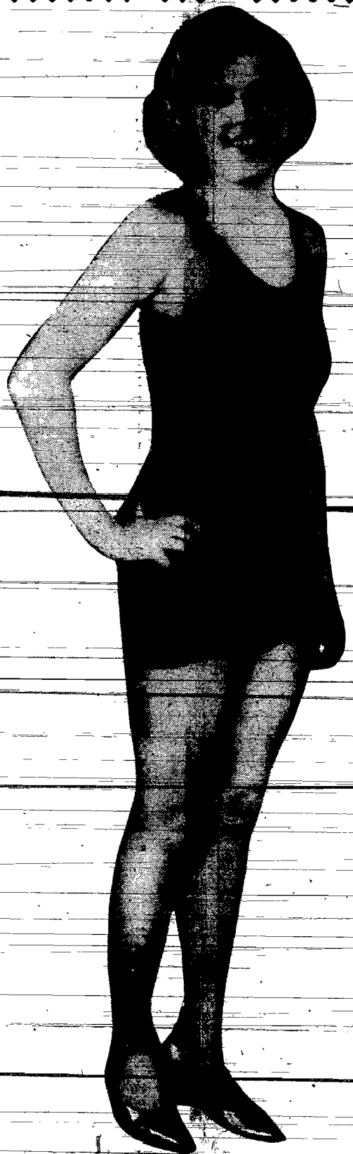
„Nie można powiedzieć, żebym była brzydka albo szęgrabna... Prawda!”