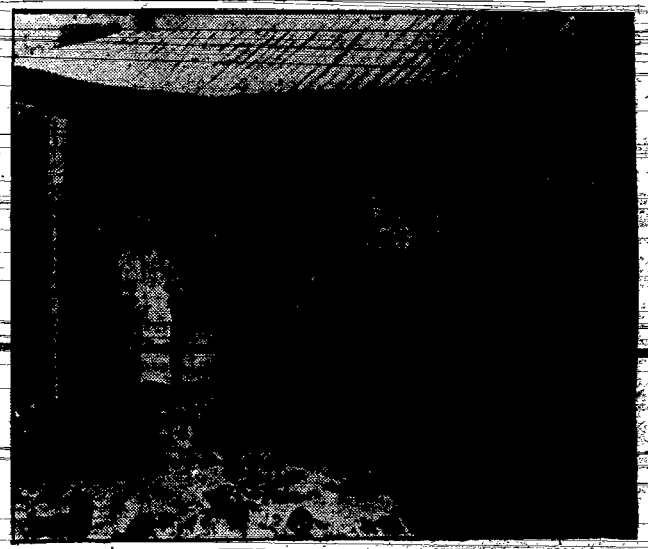
Handel futrami dzikich zwierząt w Adis-Abeba w Abisynii.