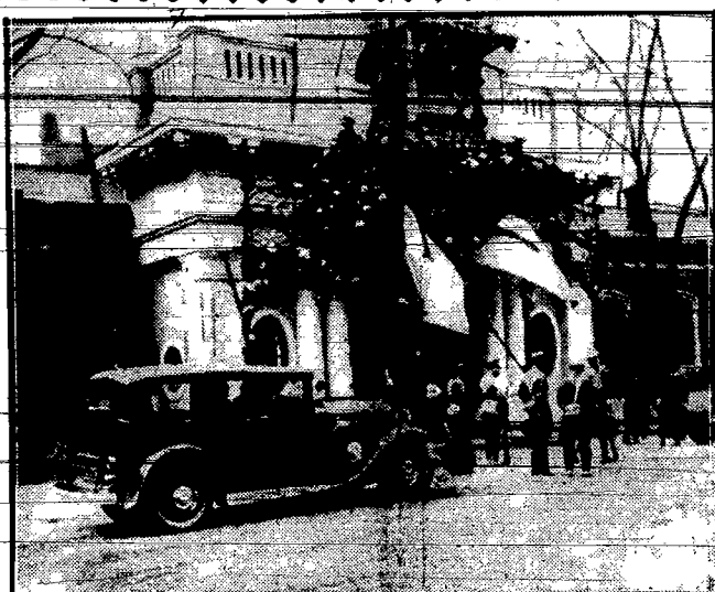
Proklamowanie nowej republiki Mandżurskiej — ze stolicy w Czangczun odbyło się z wielką pompą i paradą. Członkowie nowego rządu przybywają na tę uroczystość do pałacu prezydenta Pu — Ya.