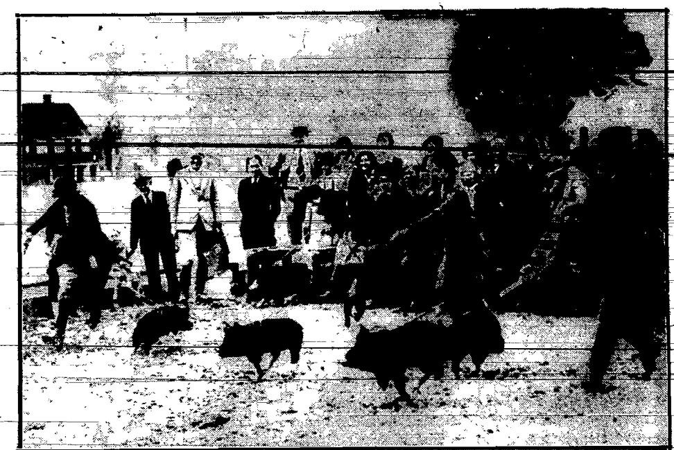
W Ameryce wynaleziono nowy sport — wyścig świni. „Konkurenci”, biorący udział w biegu o „mistrzostwo” Florydy, wrymami są na linach przez właścicieli. Na strzał pistoletowy — linki przecina się i świnki biegają do mety, po nagrodę w postaci złotych i srebrnych pułarów... Ot, Ameryka, i t.j.