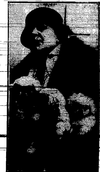
Trzy białe pieski chmskie, nagrodzone na Międzynarodowej Wystawie psów w Parwzu.