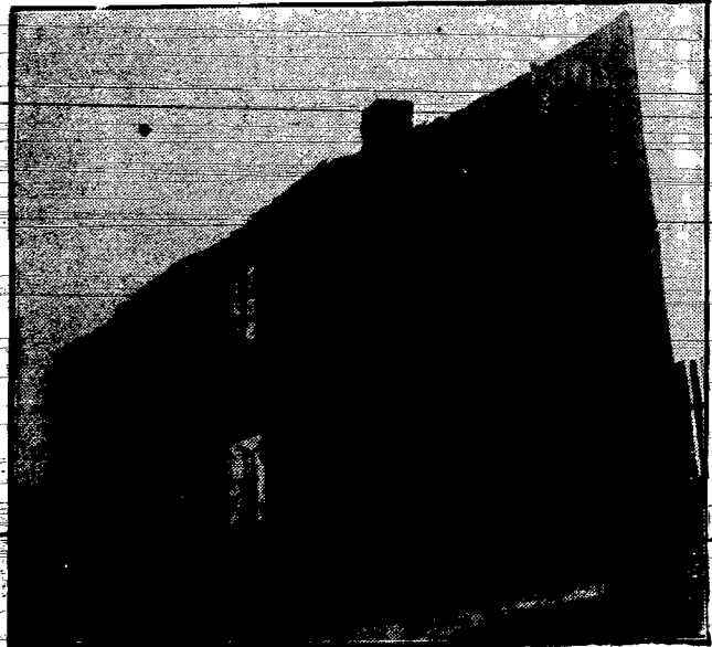
...w drewnianej ruderze...

Być może, że opowieści o nędzy nudzą. Ale nie chodzi nam o interesujący temat. Nie zajmujemy się polityką i ludziami partynem. Spełniamy tylko święty obowiązek. Ktoś musi tem się zająć, ktoś musi upomnieć się o człowieka! Ktoś musi się upomnieć o powszechne prawo do życia wszystkich ludzi!!