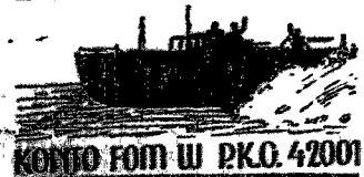
KOMIŁO FOM W P.K.O. 42001