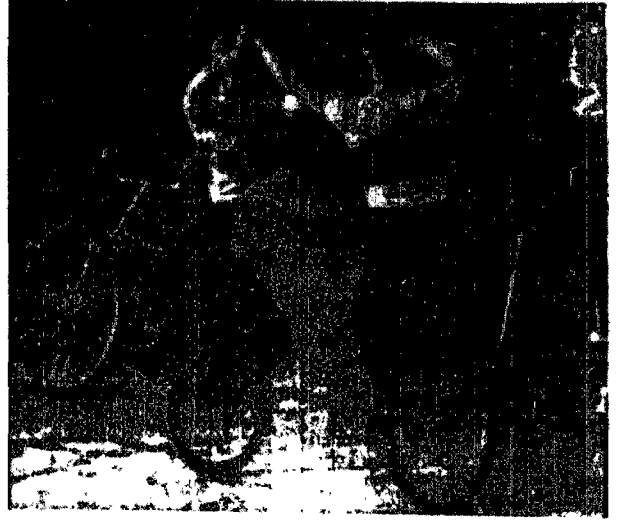
Schreder - Lephere w jednej ze swych ewolucji.