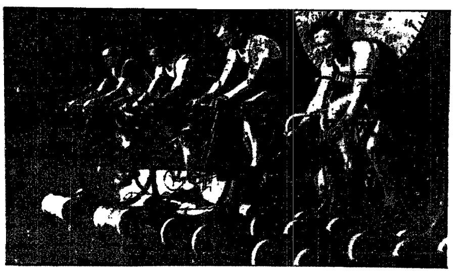
Jeden z przedbiegów na rolkach.