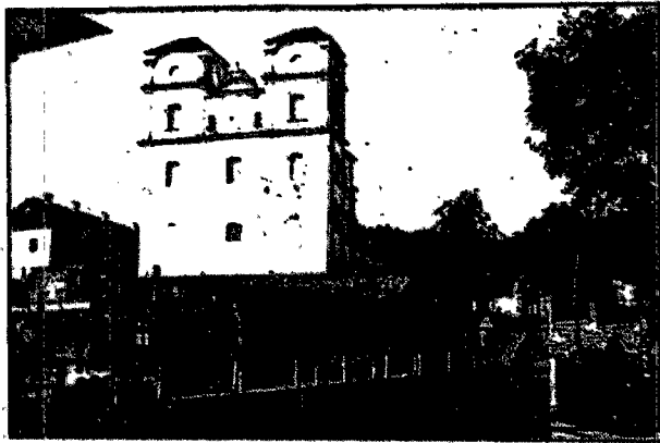
Kościół i park zamkowy w Wiśniowcu.