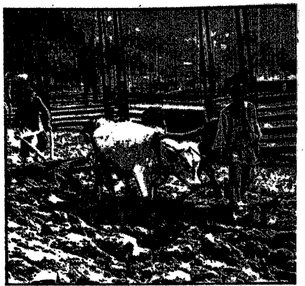
Zaczyna się orka na Pok uciu (okolice Żabiego).