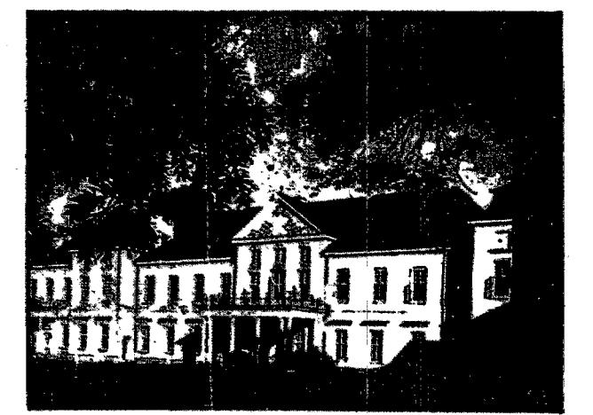
Fragment zamku Wiśniowieckiego w Wiśniowcu, zakupionego przez Liceum Krzemienieckie.

spod opresji żydowskiej, rozpoczęto prace nad założeniem w Olyce Kasy Bezprocentowej.