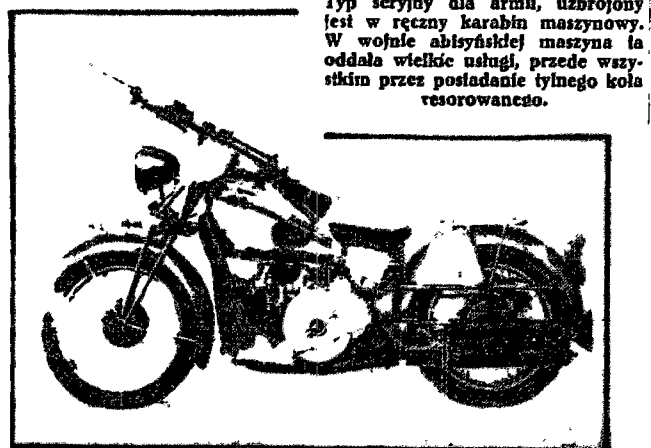
Typ seryjny dla armii, uzbrojony jest w ręczny karabin maszynowy. W wojnie abisyńskiej maszyna ta oddała wielkie usługi...