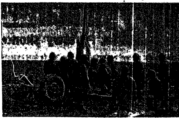
Każdy grosz wpłacony na Pożyczkę Lotniczą idzie na dobrożenie armii. Samoloty i artyleria przeciwlotnicza skutecznie będą bronić całości granic...