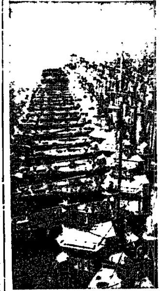
Na zdjęciu — 49 kontrtorpedowców amerykańskich, stojących w porcie kalifornijskim San Diego, gdzie po gruntownej przeróbce i modernizacji zostały włączone w jednostki bojowe Stanów Zjednoczonych.