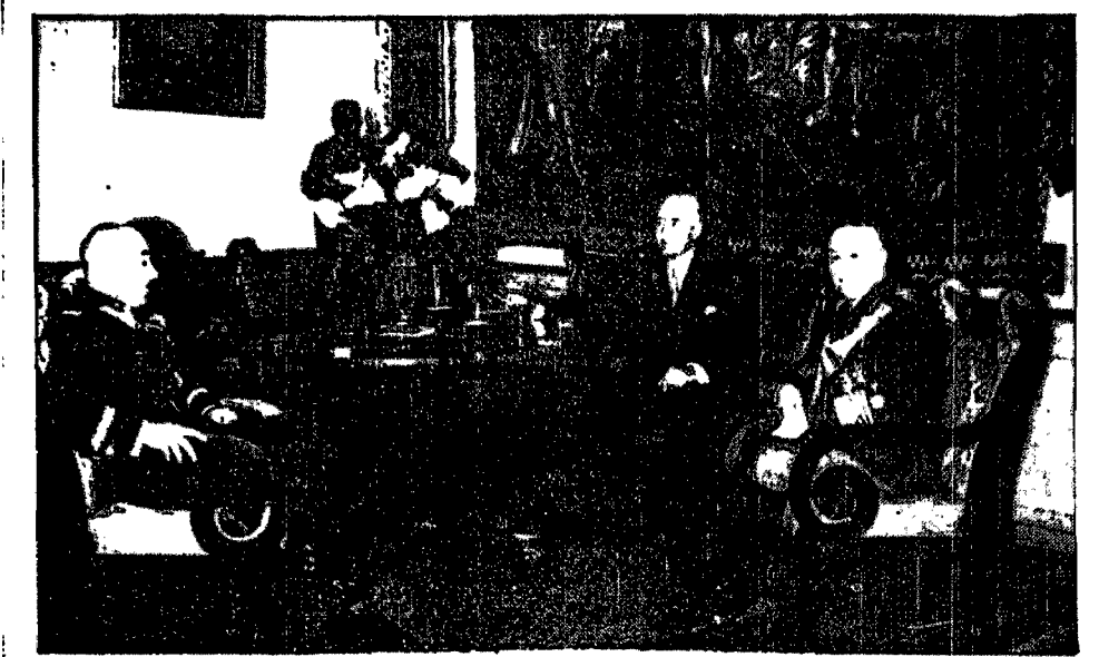
Na zaproszenie Marszałka Smigłego-Rydzę przybył do Warszawy naczelny wódz armii estońskiej gen. Laidoner. Na zdjęciu gen. Laidoner i Marszałek Smigły-Rydzę z P. Prezydenta R. P. prof. L. Mościckiego.

ry byłby to stanowisko naczelny, byłby Winston Churchill. W kołach rządowych istnieje jednak tendencja, aby nie powoływać do życia nowego ministerstwa, lecz żeby raczej utworzyć centralny urząd i postawić na jego czele wybitnego urzędnika o wielkich zdolnościach organizacyjnych z przemysłowym doradcą. Rząd uważa, że tego rodzaju urząd centralny miałby w rzeczywistości ledwo do zalewania sprawy zaopatrzenia armii lądowej. Ani zaopatrzenie floty wojennej, ani też zaopatrzenie wojsk lotniczych nie wchodziłoby w zakres kompetencji tego nowego urzędu powołanego do życia. W tych dwóch dziedzinach postępuje szyb-