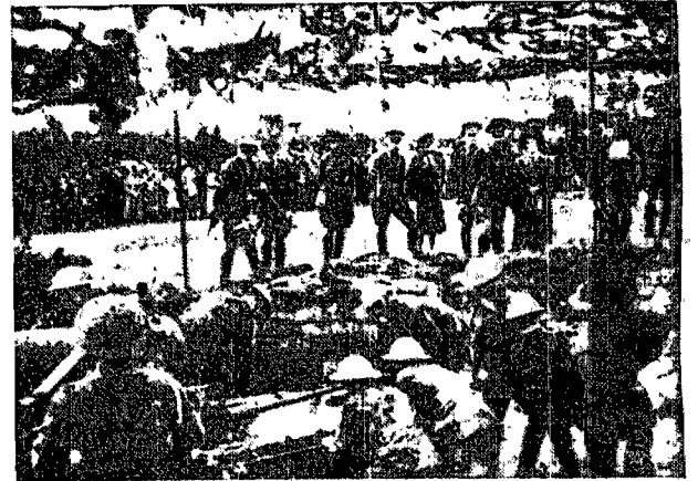
Król Jerzy VI i królowa Elżbieta przybyli do Aldershot, gdzie przegladali się ćwiczeniom wojsk brytyjskich. Po „bitwie” król dokonał przeglądu nowoczesnego angielskiego działa przeciwczołowego.