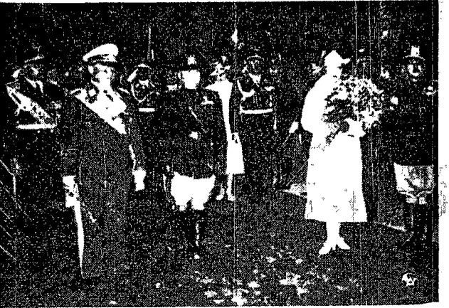
Ostatnio przybył do Rzymu marszałek Goering wraz z małżonką na zaproszenie szefa rządu włoskiego Mussoliniego, który powitał marsz. Goeringa. Na zdjęciu — moment z przybycia marszałka Goeringa na dworzec w Rzymie. Stoją od lewej ku prawej: ambasador Rzeszy Niemieckiej Mackensen, marszałek Goering, Mussolini, p. Emma Goering i młn. spr. zagr. Italii hr. Ciano.