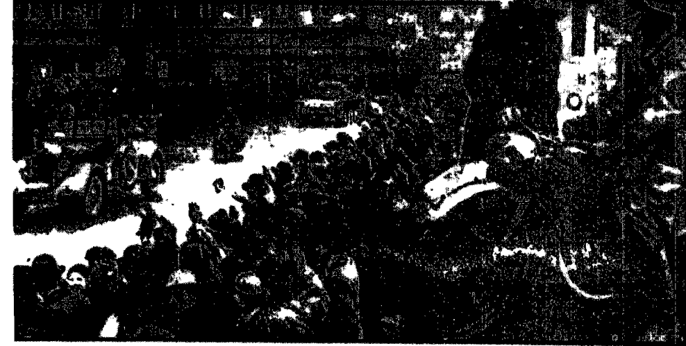
Oddziały niemieckie podczas wkraczania do Brna. Po prawej motocyklista niemiecki w rozmowie z polskim jeźdźcą.