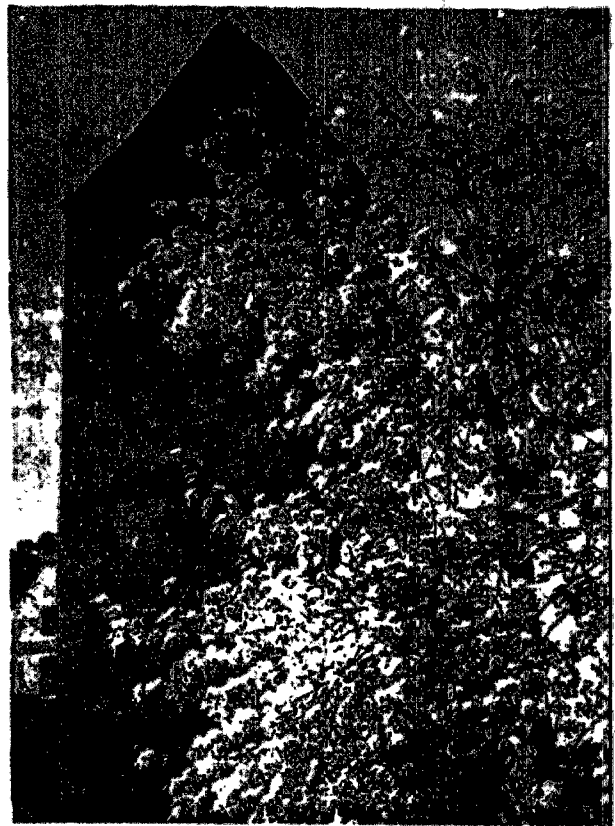
Wieża Człuchowska w C hofnackach (pocz. XIV w.).

W manifestie sejmowym twórcy konstytucji tak mówią o swoim dziele: