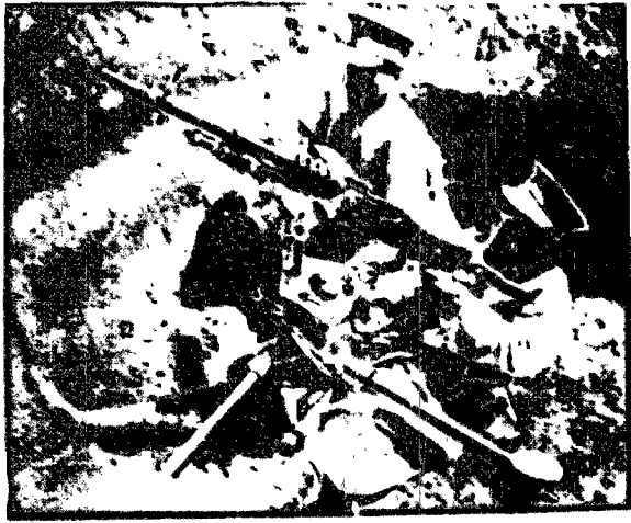
Działo przeciwlotnicze armii etiopskiej.

Wojna dzisiejsza jest wojną błyskawiczną, ponieważ broń jest tak szybka i potężna, że nie ma czasu na przygotowanie do walki. To dlatego, że wojna dzisiejsza jest wojną błyskawiczną, ponieważ broń jest tak szybka i potężna, że nie ma czasu na przygotowanie do walki.