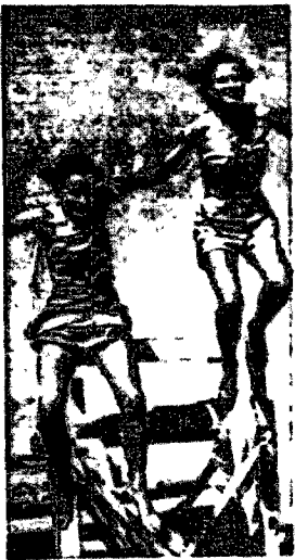
Jeszcze kilka dni upałów i - pojedziemy na plażę!