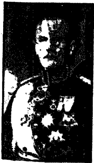
Gen. Oskar Nygren, press. tow. Szwedko-Polskiego w Sztokholmie.