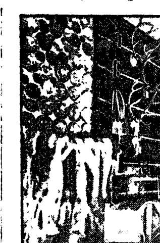
Kępcz łowiecki w pawilonie polskim na wystawie w New Yorku.