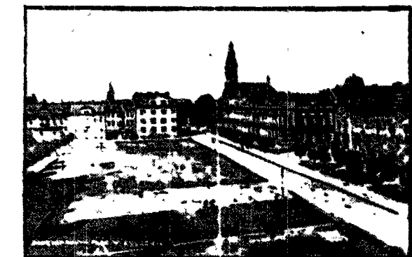
Bogumina Nowy. - Plac Wyzwolenia.