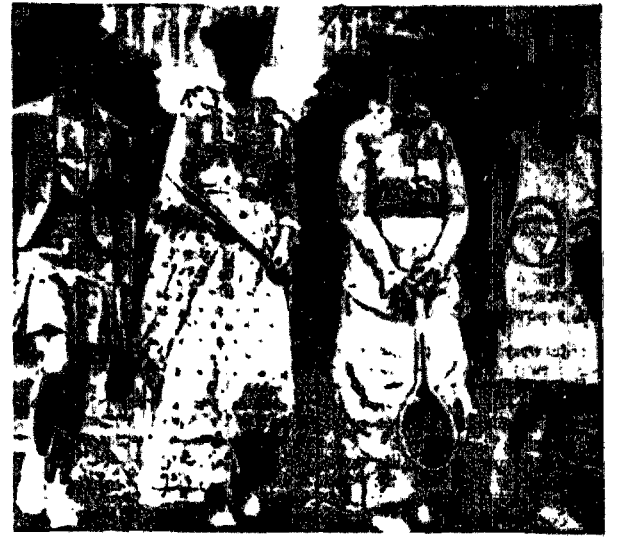
Kontrast stanowią współczesne stroje tenisowe i te sprzed lat pięćdziesiąt!