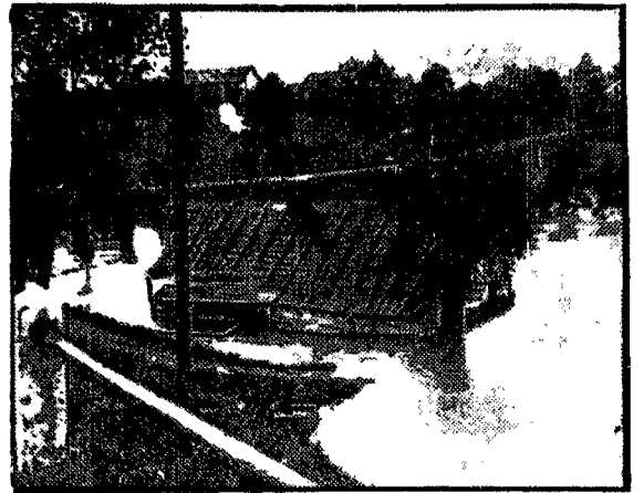
Wskutek długotrwałych deszczów i gwałtownych burz z ulewami, wystąpiły z brzegów rzeki i potoki w powiatach Cieszyńskim i Fryszlackim, zalewając okoliczne tereny.