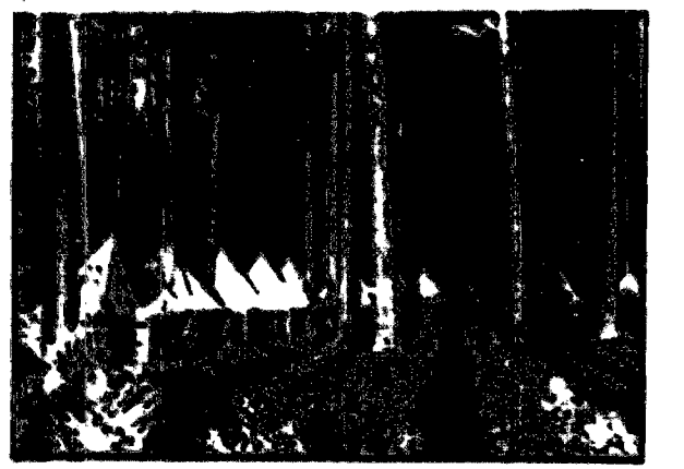
W ośrodku letnim nad jeziorem Augustowskim relaks i zabawy młodzieży rekodzielniczej.

Zagadnienie wypoczynku letniego, o którym często słyszymy, ma dla nas szczególne znaczenie. W tym celu, abyśmy mogli się dowiedzieć, jak to jest naprawdę, postanowiliśmy odwiedzić jedno z ośrodków, które w tym celu zostało utworzone.