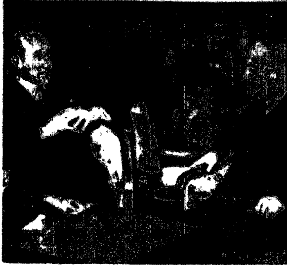
Francuski minister spraw zagranicznych Poincaré przeprowadził odywioną wymianę zdań na temat międzynarodowe z ambasaderem Piaszkim.