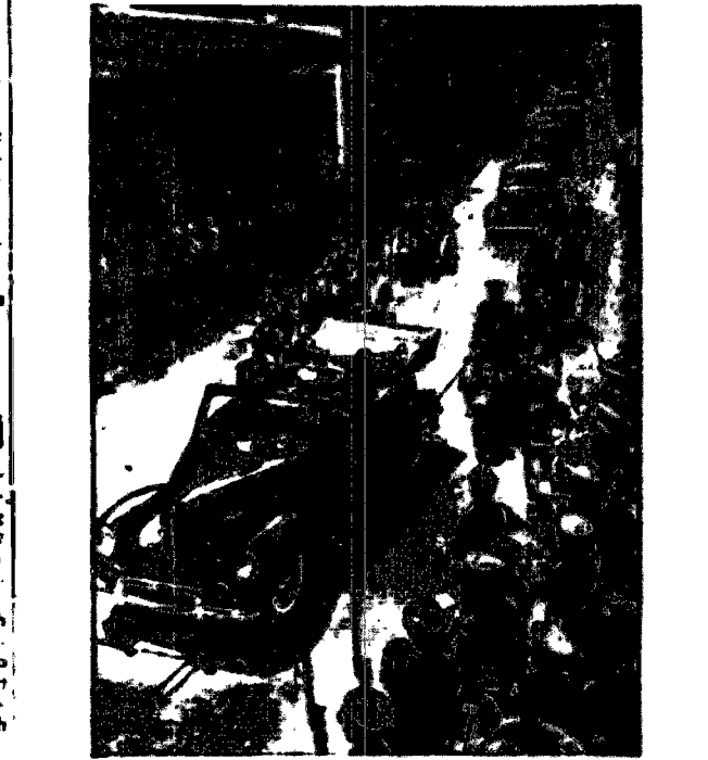
Na zdjęciu widzimy króla Jerzego VI i królową Elżbietę w momencie przejazdu przez ulicę miasta Quebec.