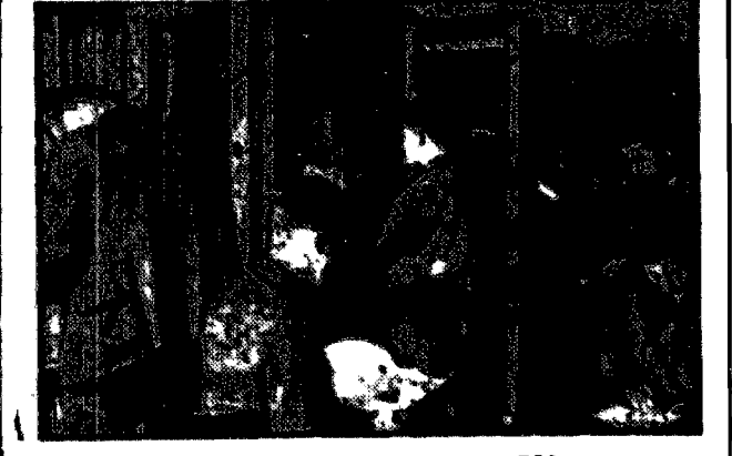
Praca młodzieży w bibliotekach ogisk ZOŚ.

tychże wstąpił... osadnicy zdają egzamin