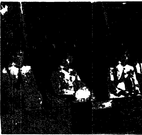
J. K. M. król Karol rumuński i w ówczesną Michal na galowym przedstawieniu cyrkowym w Bukareszcie.