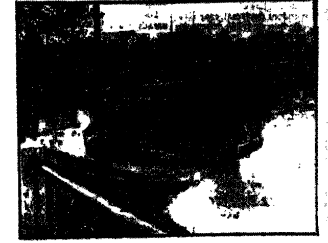
Wzrost długotrwałych deszczów i gwałtownych burz z ulewami, wystąpił z brzozy rzeki i potoków w powiatach ciechanowskim i fryszakim, zalewając okoliczne tereny. Na zdjęciu tragiczne skutki wylewu Ołzy.

Wygrane po zł 250 Wygrane po zł 100 Wygrane po zł 50