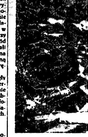
W tym miejscu po spaleniu na „antodafes” zostały rzucone do ścisłkowych, wyprodukowanego przez...