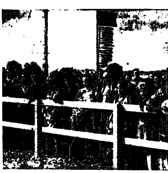
W czasie wizyty angielskiej pary królewskiej, w Kanadzie również szczepy indiańskie słotyły jej hołd.