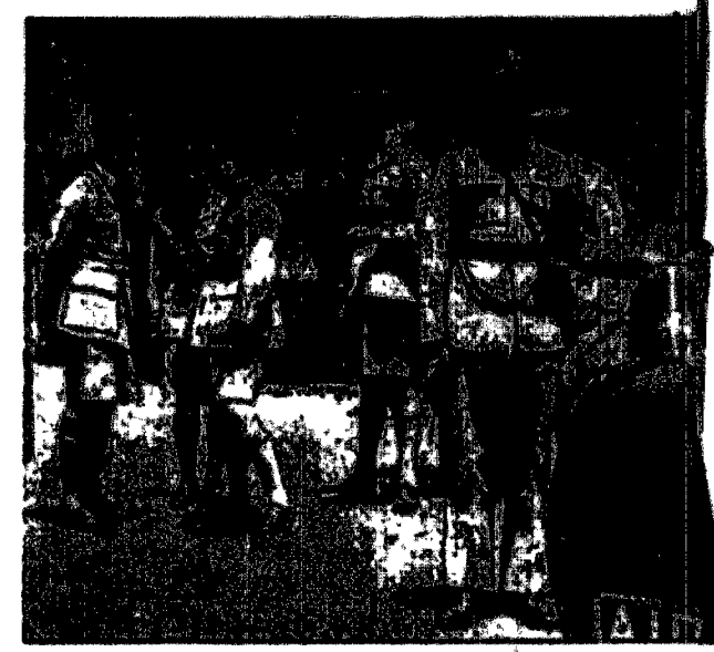
Sztab wojsk angielskich w Jerozolimie.