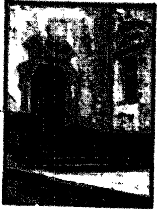
Wjeżdża do sanktuarium. Portel kamieniany (płaskowica).

Wśród wielkich form i sposobów... wjeżdża do sanktuarium. Portel kamieniany (płaskowica). Wśród wielkich form i sposobów... wjeżdża do sanktuarium. Portel kamieniany (płaskowica).