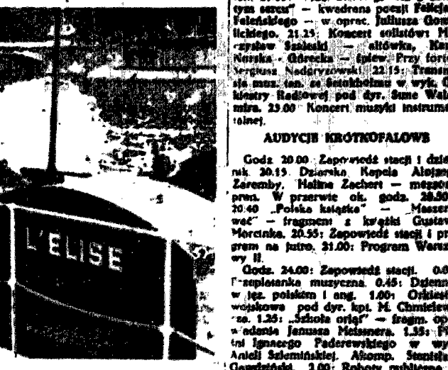
Da. 25 maja odtworzona została na Sekwanie scena historyczna... w czasie meczu...