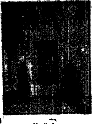
Kaplica z ryngiem Mełki Bostka.

Wielki, wspaniały, wielki... wjeżdża do sanktuarium. Portel kamieniany (płaskowica).