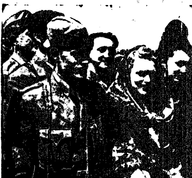
Żołnierze i ich urodzawe... Nie szukała... Nie szukała...