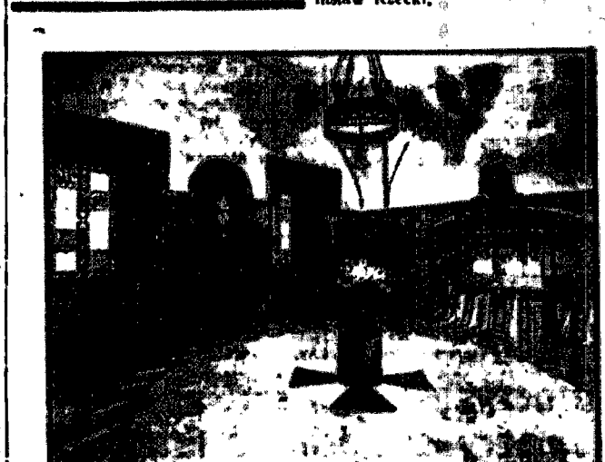
St. Rzeczki - Wnętrze sanktuarium.

W sprawie i przedstawi... prace komisji parlamentarnych.