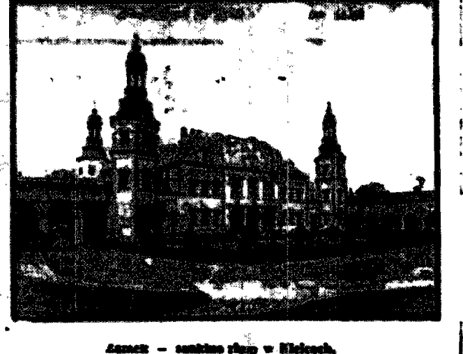
Zamek - sanktuarium w Kielcach.

między do roku, nawet przy... północna droga morska Z.S.R.R.