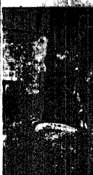
Królowa Mary... Nie szukała... Nie szukała...