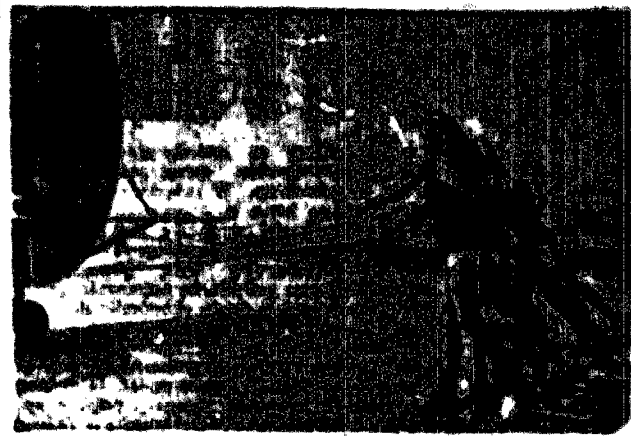
Foto upadło, która nawiedziła ostatnio Amerykę... w czasie meczu...