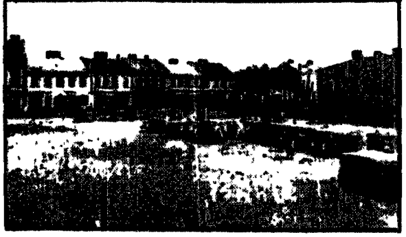
Wzrost w Skierniewicach.

wa stanowi jeden z ładniejszych fragmentów miasta. Działające nieopokrepien czas przęgi skierniewiczanie godnie i ze spokojem. Sprawy zdrowotne publiczne, ab. Gójszkie i staną na 236 t. aęry st. i podzasa gły meżowa, 20000 zawieści i dał na ten cel tyk