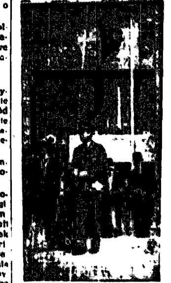
Podczas pobytu w Belgii królowa Holandii Wilhelmina zwróciła uwagę międzynarodową w Leodzie.