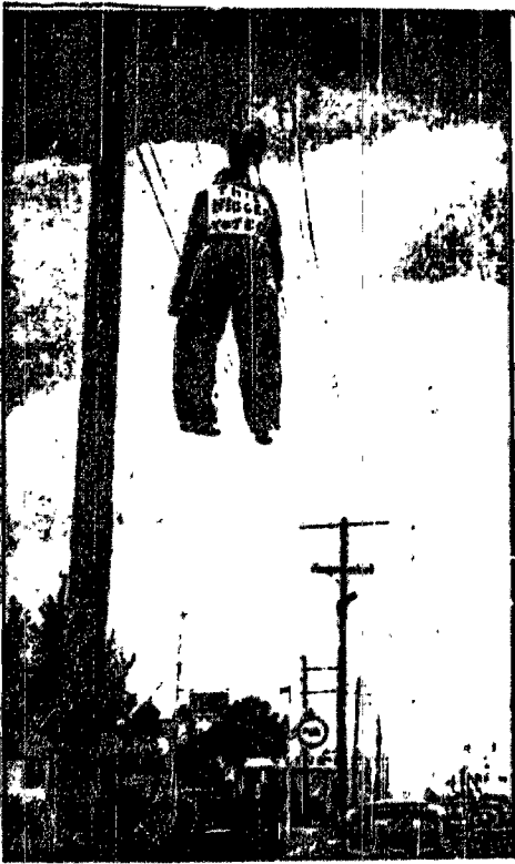
Przed wyborami w Miami, zwolennicy Ku-Klux-Klanu wywiesili kukłę murzyńską, jako protest przeciw udziałowi Murzynów w głosowaniu