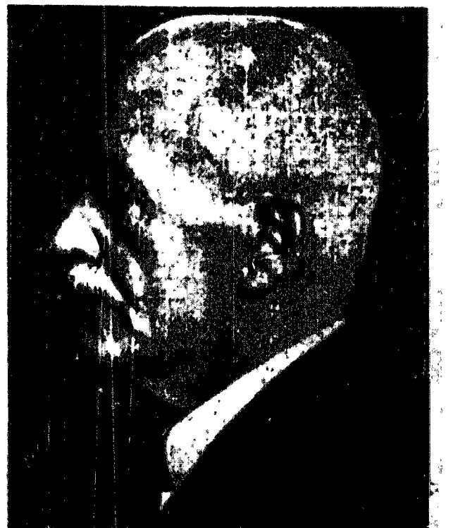
P. Prezydent Rzplitej prof. Ignacy Mościcki.