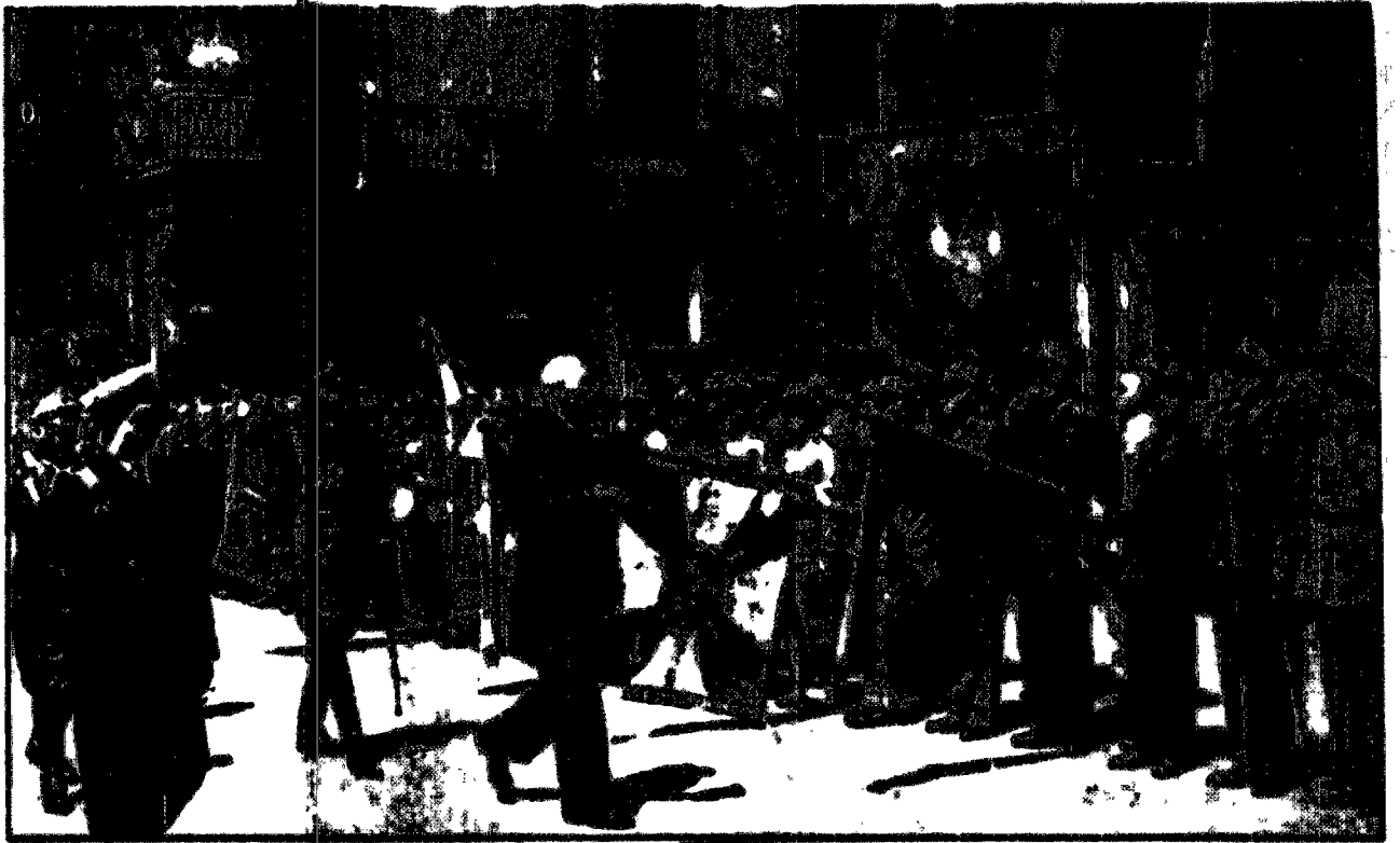
Na dziedzińcu Zamku Królewskiego w Warszawie P. Prezydent RP. przyjął oddział ochotników armii polskiej.