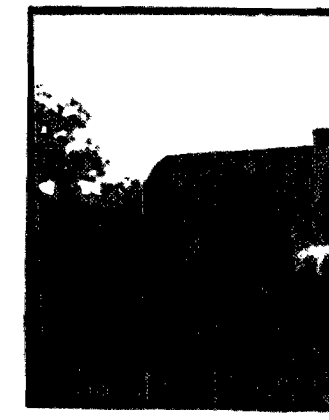
Dom wołyńskiego osadnika.

ją samobrony, choć w sądzie sta-nowią najmniejszą mniejszość, choć z-e-ważnie nie w sądzie sniły rozutki za-włać z powodu wzięcia pras osad-ników ziem.