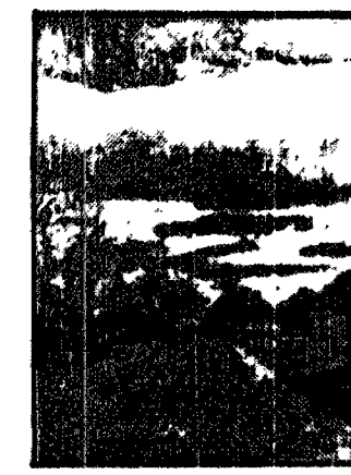
Chata w ruskiej wiosce na Wołyniu.

Osadnik wojskowy, zwał w pierw-szym rządzie na opuszczony majątki wielkich posiadaczy ziemskich. Największym kapitałem jego była i jest wiara we własne siły i prze-widywanie że z pomocą wiatru wybrano jego własne dłażenie, aby, myślał o chlebie powadziennym dla siebie i swych rodzin, nigdy nie za-pomnieli o dalszej żołnierskiej służ-bie na roli. Młodzi czynu służbę, tam albo marszu na przód.