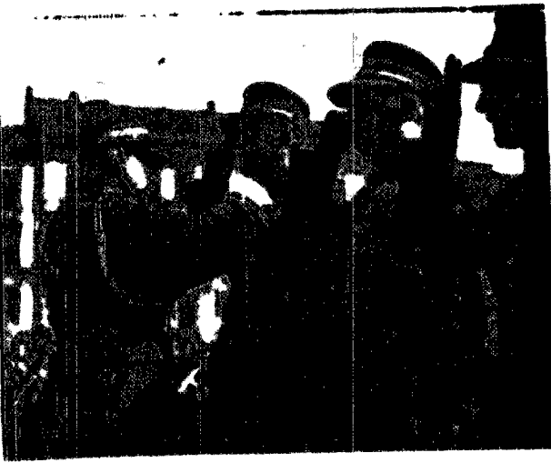
Prezenter gen. Mlawej Młodziejowski dekoruje oficerów straży pożarnej. W tle widać wystrzał z pistoletu strzelniczego w Warszawie.