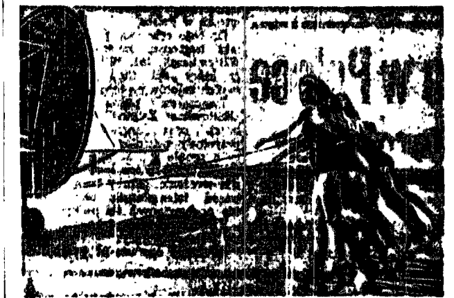
Fala upałów, która nawiedziła Amerykę wpłynęła w Chicago na powstanie nowego sportu. Piękne amerykańki, pragnąc uciec się na plażę, przypinają wrodek. Aby uniknąć jednak najmniejszego nawet wyślizgu, chwytają się i trzymają się mocno za rączki samolotów.