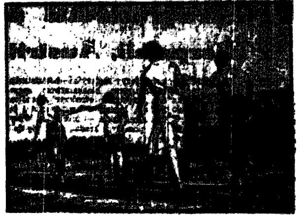
Chodźcie po szynach wcale nie jest łatwo. Pierwszą parę kroków łączy się co prawda jak z piatką, ale po kilku chwilach traci się równowagę. Trzeba więc długo trenować, aby zostać championem tego „sportu”.

Rodzice winni w pierwszej kolejności domagać się przeszkolenia dziecka w pływaniu tak jak to jest np. w obronie pilotażu.