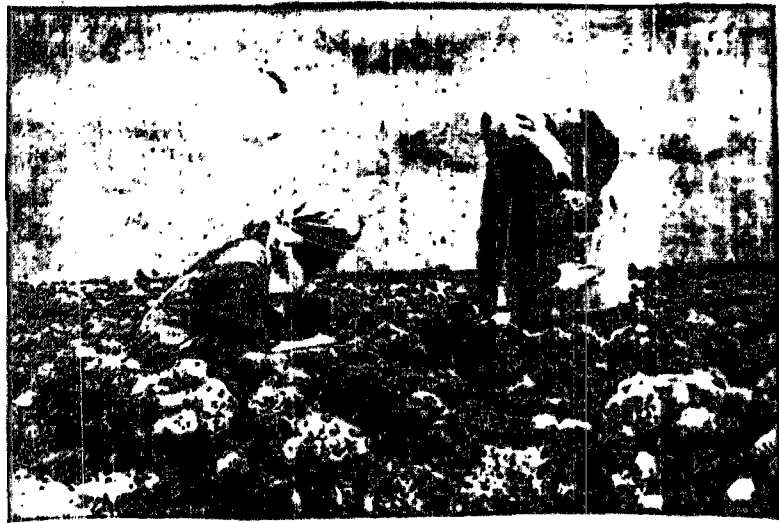
Po zakończeniu żniw wieśniaczki doglądają kapusty i ziemniaków, których zbiór rozpoczęło się za miesiąc.

Podobne zjawisko, lecz dalej posunięte, obserwujemy u robotników, pracujących w fabrykach chemicznych, metalowych, amonitacji etc. Tam bowiem opary kwasów, unoszące się stale w powietrzu, działają odwapniająco na szkliwo zębów.