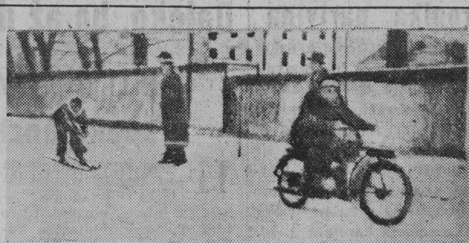
NA ZDJĘCIU: — zawodnicy na finiszu.

BIELSK (tel. wł.) — W międzyszkolnych biegach narciarskich na 9 km pierwsze miejsce