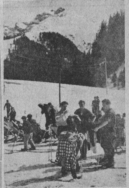
NA ZDJĘCIU: Na Kalatówkach.