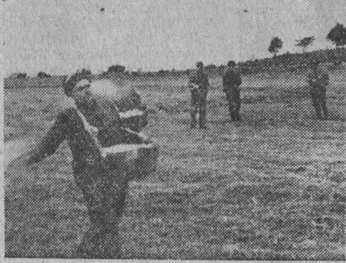
Do wieczora cały 20 hektarowy obszar łąki został zasilony nawozami sztucznymi.