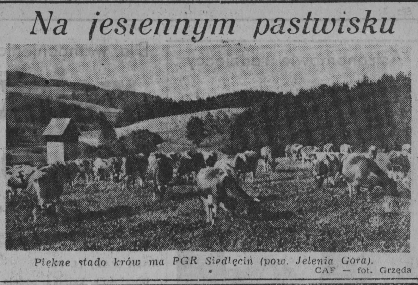
Piękne stado krów ma PGR Siedlecin (pow. Jelenia Góra).

Nad czym pracują astronomowie polscy? — patrz str. 4