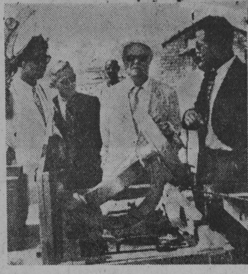
Astronomowie radzieccy, badający w Egipcie dla przyrodniczych badań plan słonecznych zbudowali obserwatorium astronomiczne w Helwan.