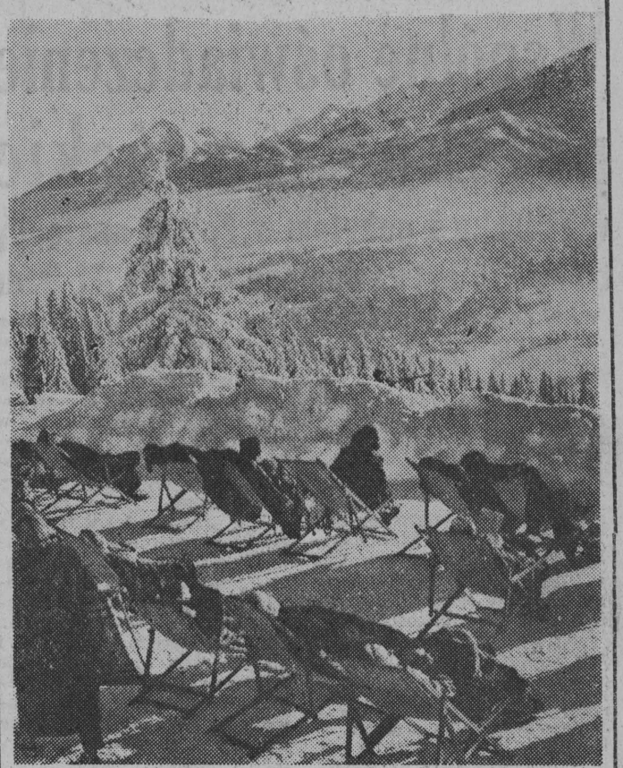
NA ZDJĘCIU: czasowice na Gubałowie...