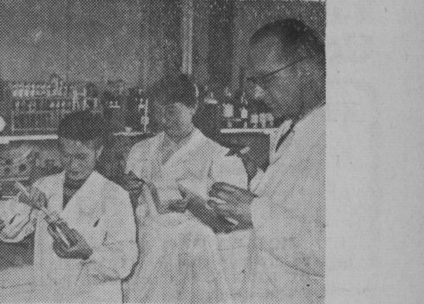
Bielskie Zakłady Tłuszczowe opracowały proces technologiczny i przystąpiły do produkcji nowego rodzaju margaryny tzw. margaryny ciałowej. Nowy gatunek nie ustępuje masłu (pod względem ilości tłuszczu, ciagliwości, temperatury krzepnięcia itp.) i nadaje się szczególnie przy wypieku tust. ciast francuskich.

NA ZDJĘCIU: nad jakością margaryny czuwa doskonale zaopatrzone laboratorium przykładowe, które bada każdy cykl produkcyjny. Jako ciekawostką można podać, że jednym z sposobów badania jest po prostu degustacja. Mając codzienną wprawę w kosztowaniu nie trudno odkryć najmniejsze niedociągnięcia.