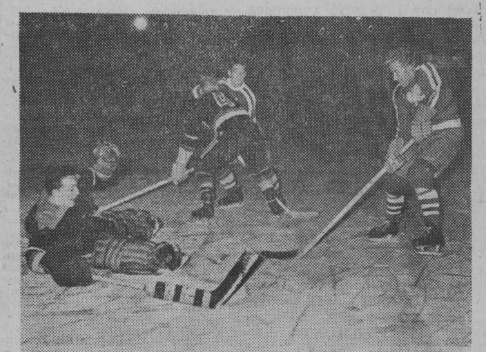
NA ZDJĘCIU: fragment meczu.

Tak więc ostatecznie reprezentacja Białegostoku przegrała 7:13. Wynik ten nie przynosi jednak ujmy. (lt)