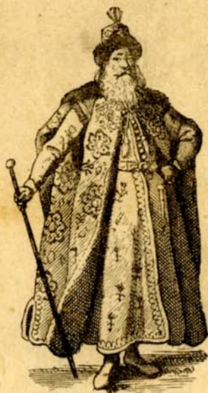
Pierre Iwanowitch Potemkine, Ambassadeur Russe