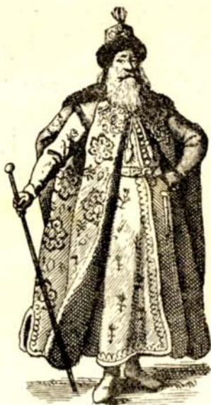
Pierre Iwanowitch Potemkine, Ambassadeur Russe

handwritten notes CATALOGUE À PRIX MARQUÉS