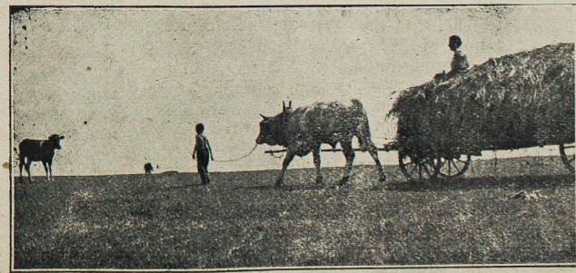
Zwózka zboża na Wołyniu.

Nikt tak jak Orkan nie odczuł duszy chłopca, nikt tak jak On nie umiał wykazać chłopcu jego wad, i nikt tak nie potrafił wskazać mu dobrych dróg życia i dać tak wiele trafnych rad i wskazówek.