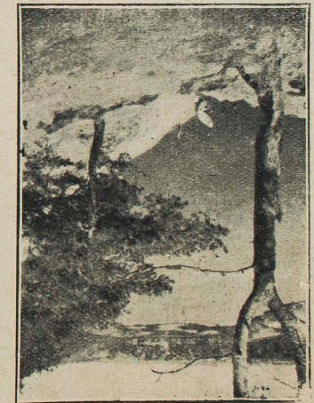
Слucz под Ludwipołem.

Кажуть люди: як би то була на селі освіта і організація, то не було би таких бідних рільників як у нас. І правду кажуть: без освіти і організації біда і нужда нас все більше і більше тисне. Але як тому бідному тої освіти, культури і організації доступити.