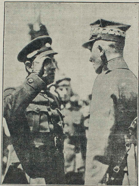
Gen. Edward Rydz-Śmigły i Główny Ataman Symon Petlura w Kijowie, w maju 1920 roku.

»Armja Polska zachowa w pamięci czasy wspólnych krwawych zmagañ z wrogiem i bohaterską postawę wojsk ukraińskich, jednokowo stałą i waleczną w dniach triumfu, jak i w godzinach ciężkich prób. Razem przelana krew i wspólne mogiły żołnierskie będą stanowiły teraz i po wszystkie czasy kamień węgielny, na którym stanie fundament zgody i szczęśliwego współżycia dwóch narodów«.