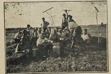
Подвечерок в полі.

Насувається ще одна увага, що дотичить на перший погляд дрібної справи, але важливої, яку можна замітити не тільки при праці Вечірніх Університетів, але і при інших випадках. Ходить про стосунок до прелегентів, які приїжджають з міста, який не завше буває відповідний. Не ходить, розуміється про те, чи прелегент подобався чи ні, а річ йде про уможливлення побуту для нього, отже питання нічлігу, в зимі при морозах загіття ніг і т. п. Особливо що до фури то або тяжко знайти або треба за неї часом надто солоно заплатити. Не завше прелегент має з чого викласти більшу суму, нероз з власної кишені. Гурток мусить зрозуміти при організації Вечірнього Університету, що необхідно з їх боку зробити якесь