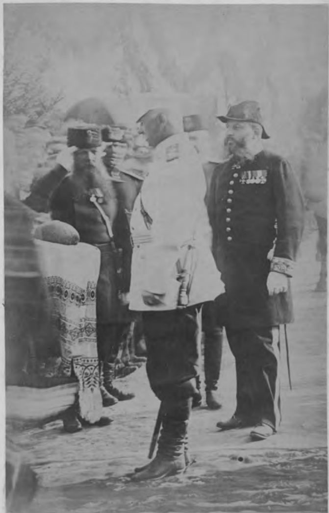
Пріемъ свѣтл. кн. А. К. Имеретинскимъ депутациі отъ города Ломжи.

23-го августа, вечеромъ, въ ломжинскомъ православномъ соборѣ и въ храмахъ другихъ исповѣданій, въ присутствіи властей, воспитанниковъ учебныхъ заведеній и массы народа, были отправлены торжественныя молебствія, по случаю радостнаго событія двукратнаго посѣщенія Ихъ Императорскими Величествами ломжинской губерніи. Ломжа разцвѣтилась флагами и была иллюминирована, а для бѣдныхъ устроены городомъ обѣды на триста человекъ.