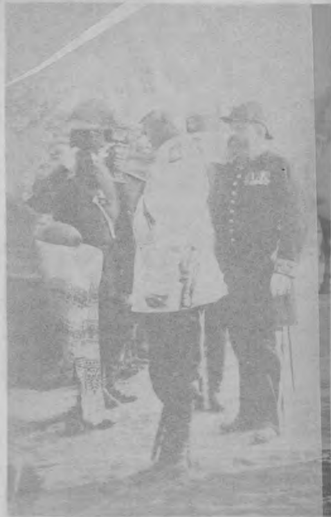
Принцъ свѣтлѣйшій кн. А. К. Имеретинскій дѣлаетъ поклонъ губернатору города Ломжи.

23-го августа, вечеромъ, въ ломжинскомъ православномъ соборѣ и въ храмахъ другихъ исповѣданій, въ присутствіи властей, воспитанниковъ учебныхъ заведеній и массы народа, были отправлены торжественныя молебствія, по случаю радостнаго событія двукратнаго посѣщенія Ихъ Императорскими Величествами ломжинской губерніи. Ломжа разцвѣтилась флагами и была иллюминирована, а для бѣдныхъ устроены городомъ обѣды на триста человѣкъ.