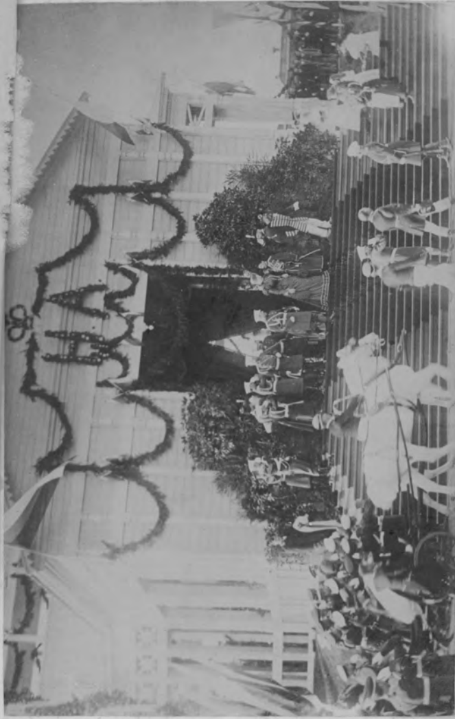
Отъездъ Ихъ Императорскихъ Величествъ на червоноборскія позиціи 19 августа 1897 года.