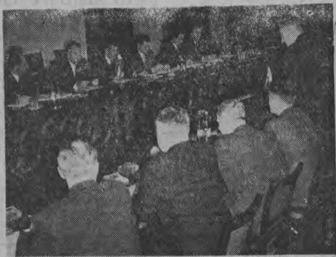
NA ZDJĘCIU: fragment posiedzenia.

15 bm. przed południem nastąpiło pierwsze spotkanie rządowych delegacji gospodarczych Polski i Jugosławii.