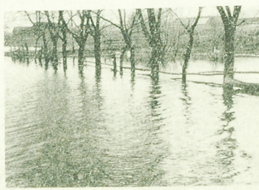
Publiczność z dużą uwagą przysłuchuje się recytacjom.