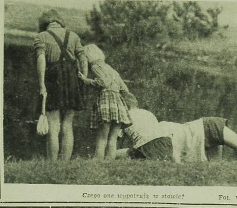
Czego one wyprawują na stawie?

Zbiór miodu zapowiada się w tym roku nie najlepiej. Pszczelarze przewidują, iż z pasieki otrzymają zaledwie jedną trzecią, a najwyżej połowę zbiorów ubiegłorocznych.