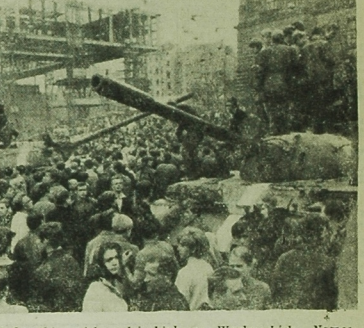
Jednostki wojsk radzieckich na Wacławskich. Należących w Pradze Czeskiej.

Z tym związane są nieuzasadnione próby niektórych państw zachodnich postawienia na porządku dziennym Rady Bezpieczeństwa ONZ tak zwanego „problemu Czechosłowacji”. Na bezpodstawność próby postawienia tej kwestii w ONZ zostało uwagą wczoraj 21 sierpnia Ministerstwo Spraw Zagranicznych Czechosłowacji podkreślając, że Czechosłowacja nie zgodzi się na jej omówienie w ONZ, ponieważ problem stosunków wzajemnych Czechosłowacji z innymi krajami socjalistycznymi jest rozstrzygnięty przez same te państwa w ramach wspólnoty socjalistycznej.