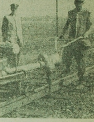
Prace z pomocą zakretniki na stacji Wasilków na odcinku drogowym Czarna Białostocka.