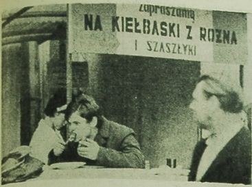
W Białostockim barze szybkiej obsługi. Smaczne potrawy