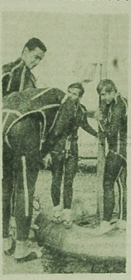
W dniach 22-28 września na Jeziorku Charkowskim i Chojniku odbył się VIII Międzynarodowy Zjazd Plebiscytarstwa organizowany przez ILS, Związek Ziem Polski ZSR i NRD...