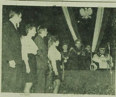
Uroczysta pierwsza w historii uczelni immatrykulacja studentów I roku.

Dziś święto narodości Niemieckiej Republiki Demokratycznej. LIPSK — fragment miasta z omachem przebudowanego ostatnio uniwersyteckiego pomostu towarowego o podłożu 11.000 m kwadrat.