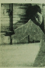
NA ZDJĘCIU: kadry z filmu.

Reżysera Waldemara Podgórnika kierując przede wszystkim ludźmi wykonawczą, nie niedołężną i namiętną ofiarności, inteligencji i odwagi, prace. Zdawali się, w czasach gdy na usługi władz bezpieczeństwa oddaje się zdobywczo najnowocześniejszej techniki,