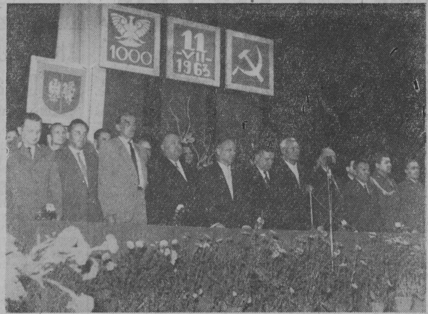
Prezydium uroczystej sesji WRN, MRN i PRN w Białymstoku.

Jak się oblicza, realizacja tego programu „pochońie” ok. 88 tys. ha terenów.