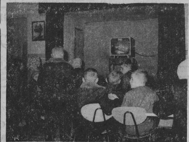
NA ZDJĘCIU: podczas oglądania programu telewizyjnego.