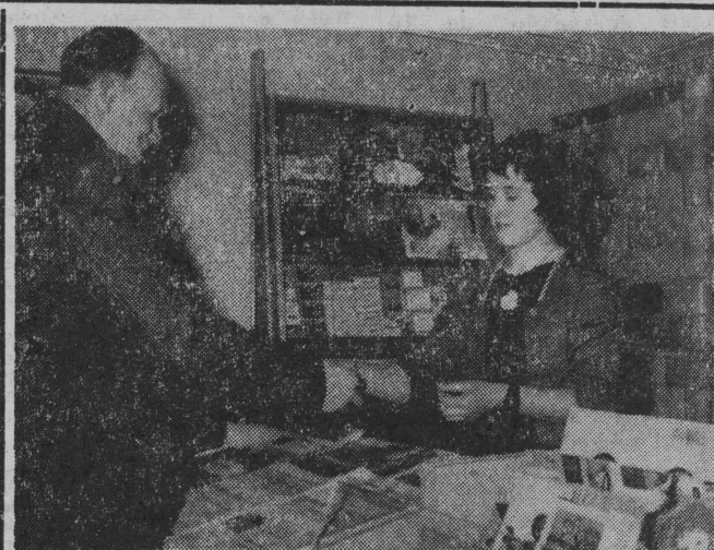
NA ZDJĘCIU: pierwszy klient.

cji ma duże znaczenie. Zmniejsza towarzyszy do rzetelnego zastanowienia się nad sytuacją i możliwościami organizacji. A to jest przecież jednym z celów kampanii wyborczej w partii. (EFEL)