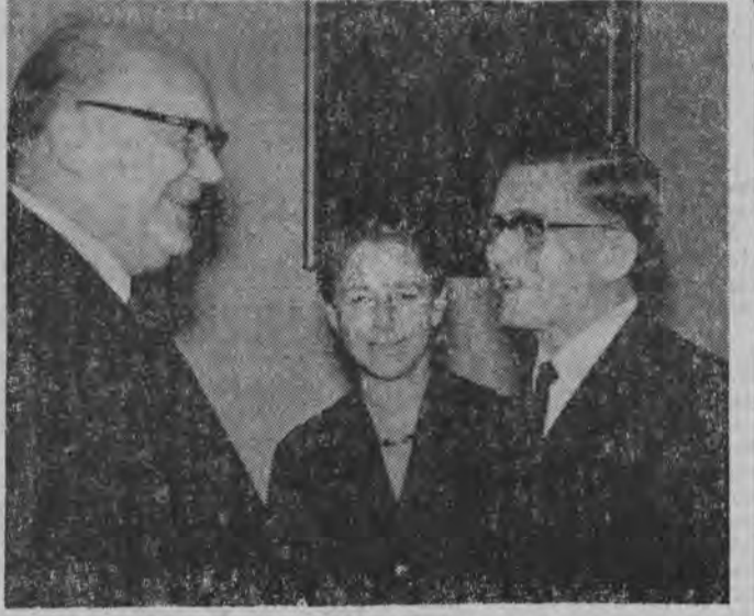
W dniu 9. XII. 63 r. wicepremier i minister Spraw Zagranicznych Belgii Paul Henri Spaak złożył w Belwederze wizytę przewodniczącemu Rady Państwa Aleksandrowi Zawadzkiemu.

P. H. Spaak opuścił Polskę WARSZAWA (PAP) — We wtorek 10 bm. w godzinach południowych wicepremier i minister Spraw Zagranicznych Belgii — Paul Henri SPAAK opuścił Polskę, udając się drogą powrotną do swego kraju. Bezpośrednio przed