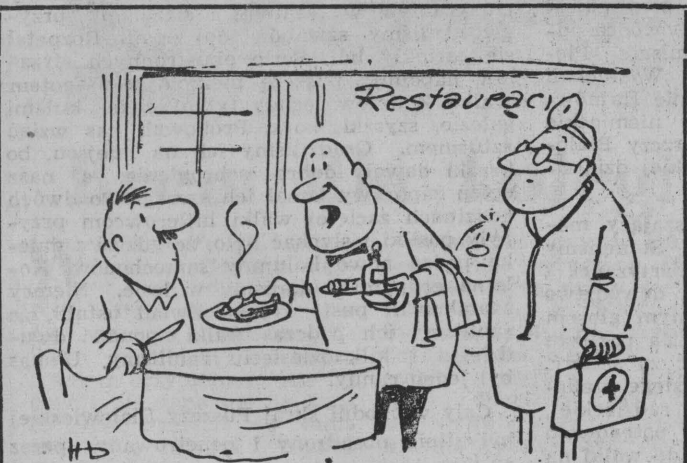
— Mamy tyle reklamacji co do jakości potraw, że dyrekcja postanowiła w ramach „dodatku do dania” dodawać poradę lekarską...

Wszelkich informacji w sprawie warunków prenumeraty udziela placówka „Ruch” i Poczty. Adres Biura Reklam i Ogłoszeń Białostockiego Wydawnictwa Prasowego, Białystok, ul. Wesolowskiego 1.