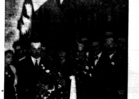
Nasz nowy mistrz w otoczeniu przedstawicieli Polskiego Tow. Lowieckiego na Dworcu Głównym w Warszawie.