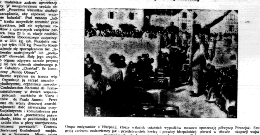
Grupa emigrantów z Hiszpanji, którzy wskutek ostatnich wypadków masowo opuszczają półwysep Pirenejski. Emigracja zarówno cudzoziemcy jak i przedstawiciele lewicy i prawicy hiszpańskiej; pierwsi w obawie okupacji wojsk powstańczych, drudzy z trwoży przed czerwonymi milicjami.