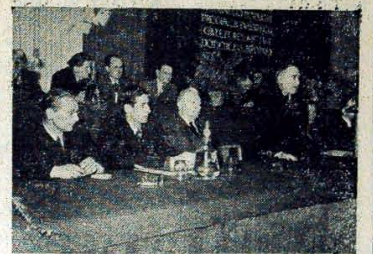
Dnia 18 lutego b.r. zakończyła się w Warszawie 3-dniowa narada aktywu naukowego i gospodarczego w sprawie zwiększenia bazy paszowej w kraju. Na zdjęciu: Fragment prezydium.