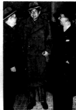
Na zaproszenie Mussoliniego przybył do Rzymu wicekanclerz austriacki hr. Starheimberg (w środku).