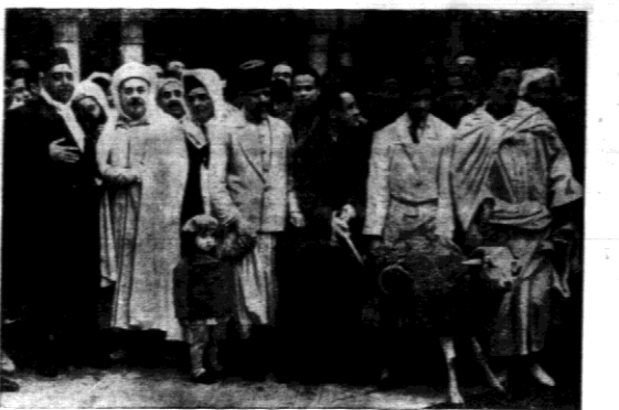
W paryskim meczecie odbyło się w obecności eksultana Marokka Mahaly Hafida święto religijne Abal Kerib. Na zdjęciu ten zabiegający owce, a mimo ich rozmiarów między obiegach.