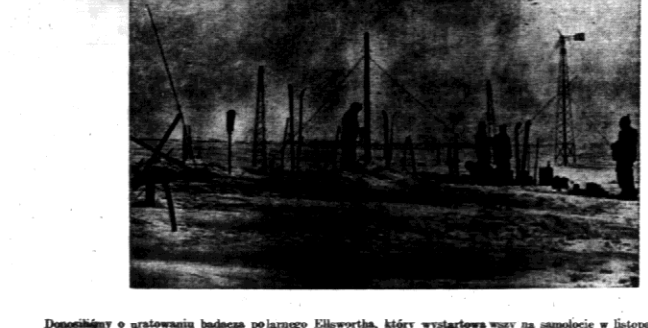
Donosiłoby o uratowaniu badacza polarnego Ellswortha, który wystartował w samolocie w listopadzie r. ub. do badań podbiegunowych, dopiero w styczniu został uratowany.