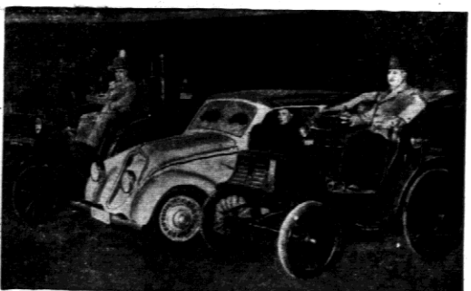
Trzy wozy ostatniego pięćdziesięciolecia.