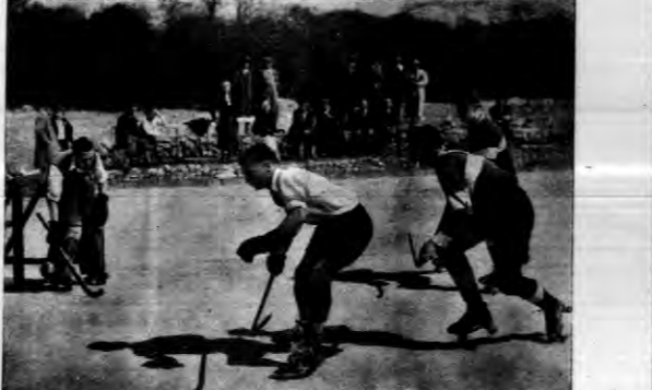
Hokei, który już sam przez się jest grą polegającą na szybkości, zyskuje jeszcze na tempie, gdy zostaje rozgrywany na wrotkach. Hokej na wrotkach jest doskonałym treningiem dla hokeistów na lodzie...