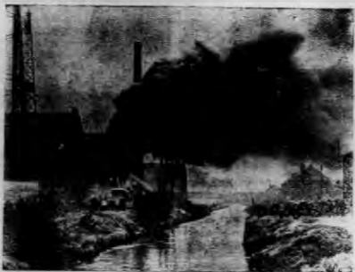
W mieście Louvain w Belgji wydarzyła się strasna eksplozja zbiornika z gazem. Katastrofa ta pociągnęła za sobą wiele ofiar w zabitych i rannych. Zdjęcie nasze przedstawia widok pożaru zgasłego, w chwilę po wybuchu.