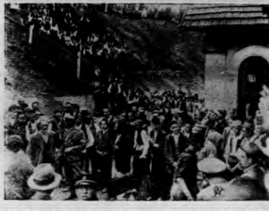
Pod Serajewem w kopalni węgla kakan wydarzyła się strasna katastrofa. W wybuchu gazów, która pociągnęła za sobą poważne ofiary. Na zdjęciu tłumy okolicznych wieśniaków, którzy przybyli jako wolontariusze, pomagając w pracach ratowniczych.