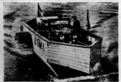
Nowy rodzaj promu dla samochodów wyprobował obecnie w Amersee (Górna Bawaria). Oryginalność konstrukcji polega na tym, że koła wozu prowadzą w ruch motor, który porusza prom.