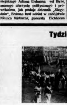
Ważny dzień jako pierwszy dzień XI Tygodnia LOPP odbył się w Warszawie obchodny pakt propagandowy z udziałem delegacji wszystkich okręgów i oddziałów z beta kłuch organizacji społecznych, biurokracji i innych udział w pracy obywateli z udziałem LOPP. Z lewej fragment pochodu na Placu Zamkowym z prawej jeden z wozów propagandowych.