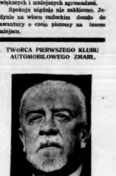
Portrait of Stanisław Wojtkiewicz, mentioned in the article.