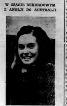
New Zealand aviator Jean Batten in flight. She is the first woman to fly around the world. She flew from New Zealand to Australia, setting a new record for the fastest flight around the world.