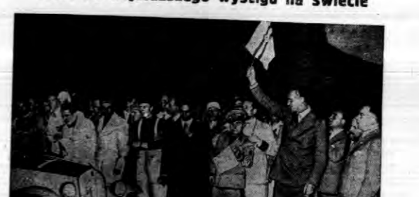
W trzech etapach odbywa się wyścig samochodowy Rzym — Messyna — Mediolan — Rzym. Startem 250 uczestników jest książę Amos de Savoyna (z chorągiewką).