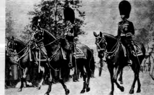
Król Jerzy w towarzystwie obu swych starszych synów...