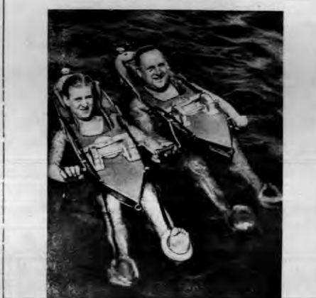
Wynalazek dla niemiejczych pływać i leniwców. Aparat ten wprawia się w ruch rękami, steruje się nogą. Głowa pływającego spoczywa na poduszce. Jak widać na zdjęciu, jest to bardzo wygodne urządzenie.