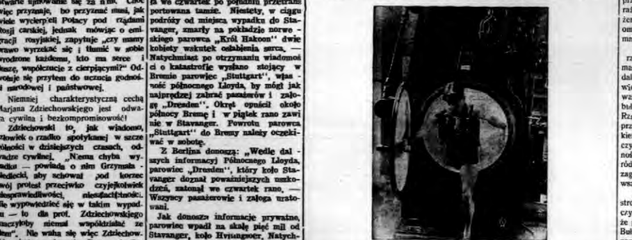
W porcie w Portsmouth zainstalowano specjalne aparaty dla ćwiczeń ratowniczych załóg łodzi podwodnych. Aparat składa się z odpowiednio urządzonego rezerwuaru napełnionego wodą oraz przylgiwejcej do niego kabin.