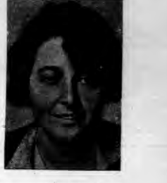
Wiceprezydentka Thea Rasche.

Wszystko to mniej świadczy o stosunku zasadniczo wrogim Macedonii a raczej o chęci naprawienia stosunków z Jugosławją, na które wycieczki macedońskie wpływają bardzo ujemnie.