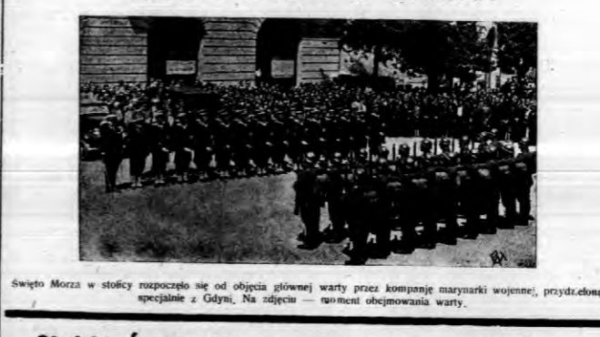
Święto Morza w stolicy rozpoczęło się od objęcia głównej warty przez kompanię marynarki wojennej, przydzieloną specjalnie z Gdyni. Na zdjęciu — moment obejmowania warty.