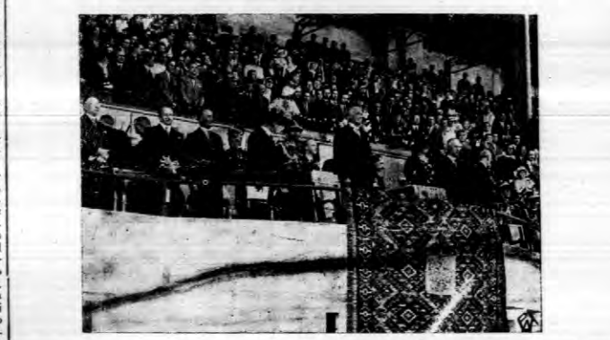
W ub. środy na stadionie Wojska Polskiego odbyło się otwarcie...