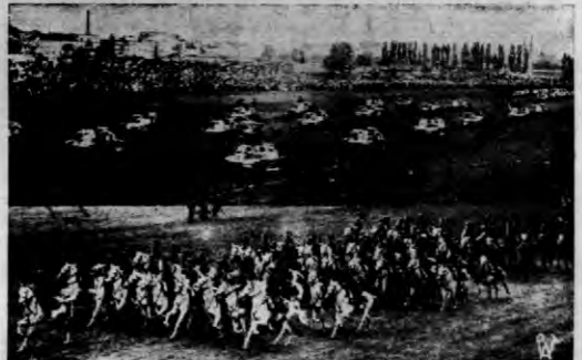
W ub. niedzielę w 30-ty rocznicę wyjazdu Kompanji Kadrowej z Krakowa odbyła się na lotnisku mokotowskim wielka rewja wojskowa. — Na odjezdu u góry oddział czołgów, u dołu — 2-gi szwadron pionierów w defiladzie.