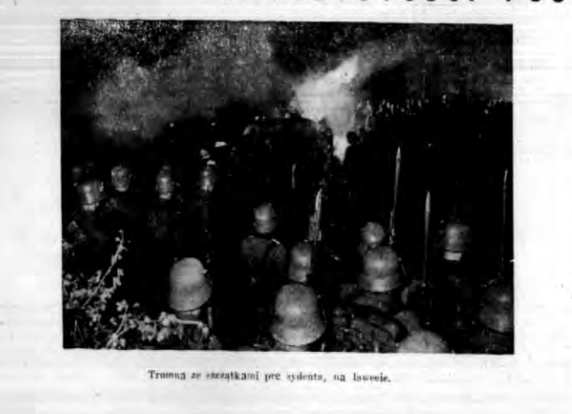
Tramaj z szesnastką prezydenta, na lawce.