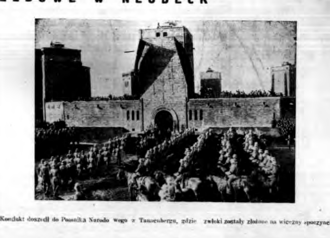
Kondukt doszedł do Pasażnika Narodo wego z Tannenberga, gdzie zwłoki zostały złożone na wierzchołku szczytu.