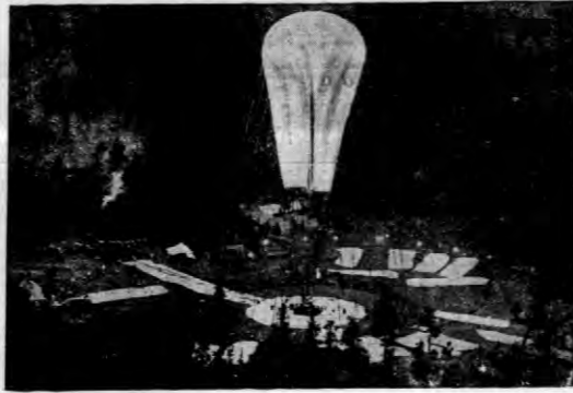
Balon w dolinach Black Hills, bezpośrednio przed wzlotem, który doprowadził do osiągnięcia wysokości 17200 m, na której powlaka się rozdarła, co spowodowało spądanie.