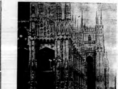
Uczestnicy wielkiego biegu alpejskiego o po drodze na Nizy, mijają katedrę majolajską.