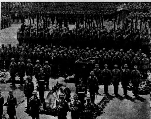
Hitler przemawia nad trumną pod Tannenbergiem.