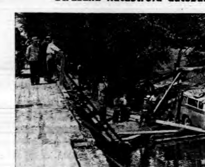
Autobus pasażerski, który uległ katastrofie koło stady Salowo, spadając do Bugu, został przy pomocy saperów i marynarzy wydobyt. W auto busie znajdowały się 20 osób. Ponadto rękawic i osób wydobyto bo...