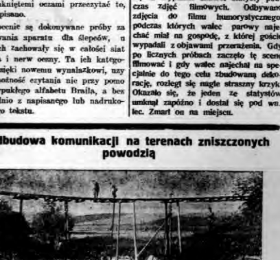
Saperzy 1-go haonu przy budowie mostu kolejowego koło st. Mełina. W miejscu tem powódź spowodowała olbrzymią wyrwę w nasypie kolej.