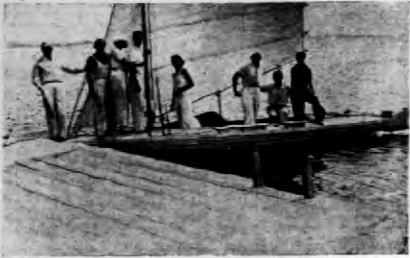
Uczestnicy kursu żeglarskiego.