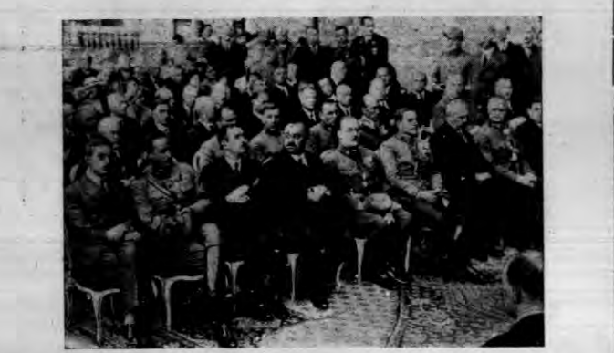
Rząd austrijski na akademji: od lewej ku prawej: kanclerz związkowy dr. Schuschnigg, wicekanclerz ks. Starhemberg, minist. handlu Stockinger, min. finansów dr. Buresch, min. apr. awanturzystki bar. Berger - Waldeneck, generały komisarz państwa w. Fey, burmistrz dr. Schmidt.