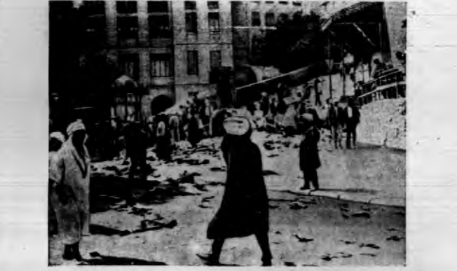
Rozruchy antyżydowskie w Algierze przybrały groźny rozmiar, przyczyną 25 żydów utraciło życie, a przeszak 100 zostało rannych. Zdjęcie nasze przedstawia jedną z ulic pokrytych żużlem i zabiciami ubrań po spłądowaniu sklepów.