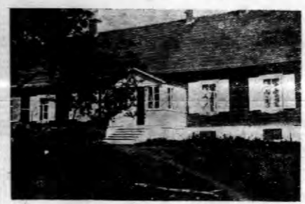
Dwór w Andrzejewie.