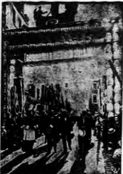
W Boulogne sur Mer odbyły się w tych dniach tradycyjna wielka procesja ku czci Najświętszej Marii Panny z Tyulu. Na zdjęciu — brama zbudowana z beczek przez marynarzy z okazji procesji.