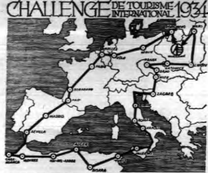
Dla ułatwienia Czytelnikom orzeczeń każdego dnia, podawac bę...