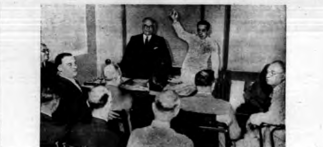
Ostatnie zebranie ugodowe w Waszyngtonie, które miało doprowadzić do zgody między fabrykantami i robotni- kami. Zgody nie zdołano osiągnąć, wskutek czego zastrajkowało 300 tysięcy robotników.