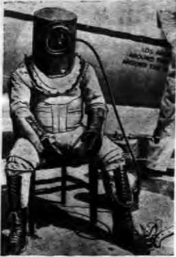
Amerykański rekordzista w locie dookoła świata Willy Post, skonstruował sobie kostjum ochronny, będący właściwie kostjumem nurka, który umożliwi mu osiągnięcie wysokości do 18000 metrów w samolocie.