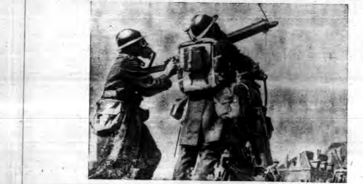
W ostatnich trzech dniach odbyły się w Brukseli wielkie ćwiczenia w obronie przeciwlotniczej i przeciwgazowej...