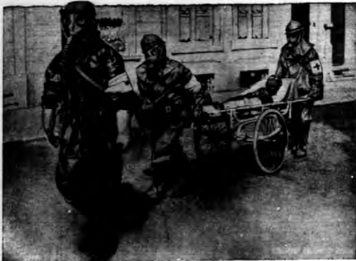
Patrol ratunkowy na ulicach Brukseli podczas większych tego rodzaju ćwiczeń urządzonych ostatnio w Belgii.