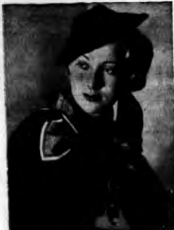
Wdzięcznym uzupełnieniem tegorocznej mody jesiennej są szal i rękawiczki, estetycznie skombinowane, miiimóżnorodności kolorów i kształtem.